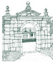
QUINTA DO ERVEDAL